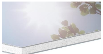
дзеркальний SB007, 4 мм 1250x3200 мм 49 $/м 2