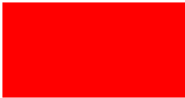
червоний SB005, 3 мм 1500x6100 мм 24 $/м 2