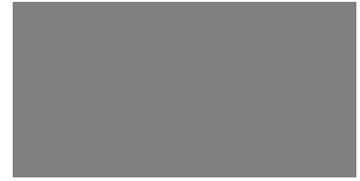
темно-сірий SB013, 3 мм 1250x6100 мм 24 $/м 2