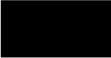
чорний SB004, 3 мм 1500x6100 мм 24 $/м 2

Легкі та жорсткі водночас. Довговічніші порівняно з пластиком або деревом. Прості в обробці